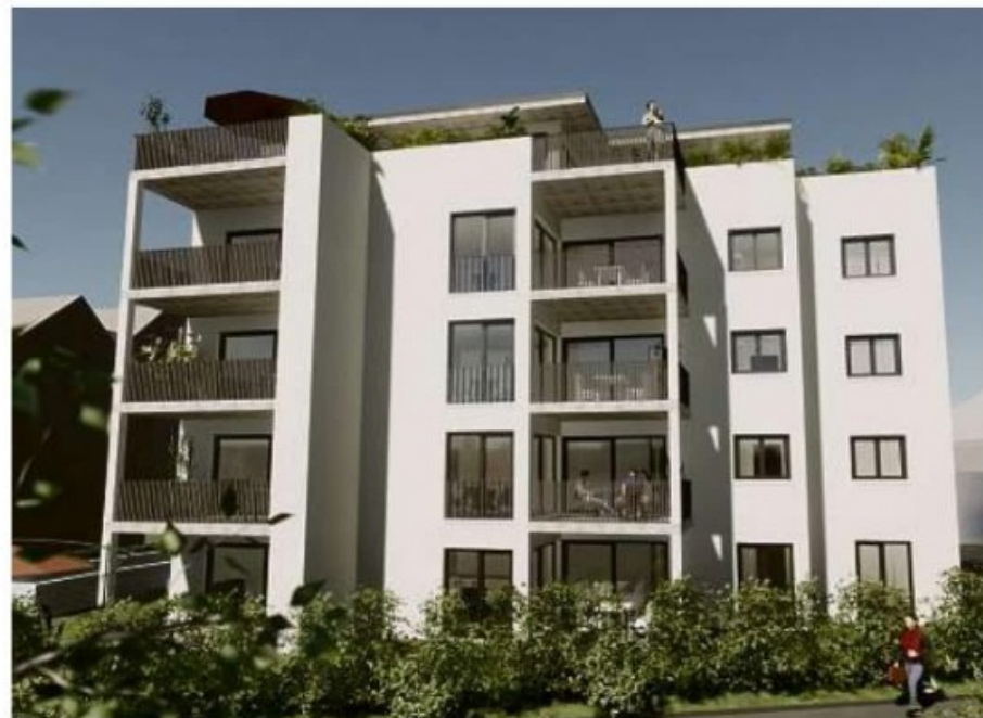
◀ Residenz 14 , Ansicht Brüelstrasse ▼ Residenz 14 , Ansicht Remisbergstrasse